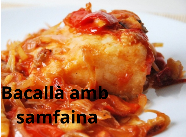
Bacallà amb samfaina