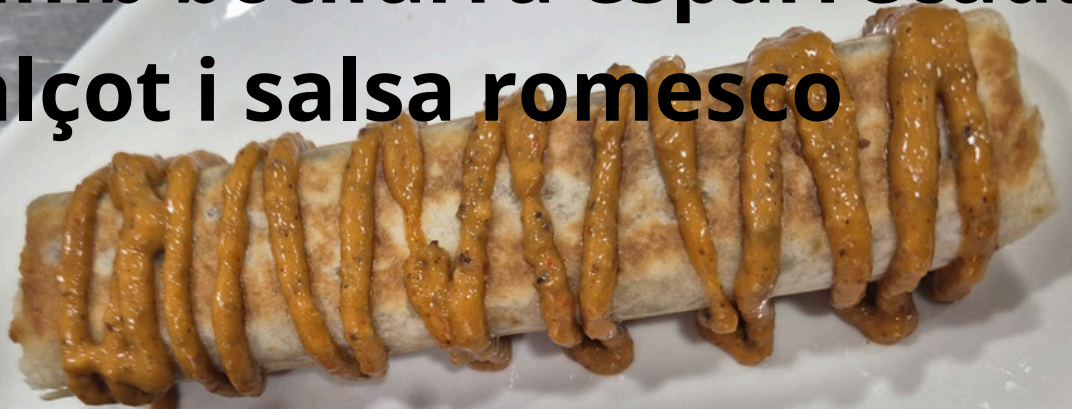
Burrito amb botifarra esparrecada, calçot i salsa romesco