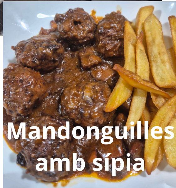
Mandonguilles amb sípia